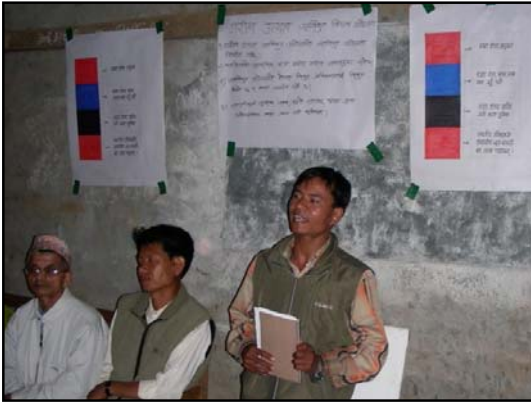
चित्र नं. ३: समुदायलाई गरीबमुखी जलविद्युत आयोजनाको जानकारी गराउँदै

पी.पी.एच.पी.को सबैभन्दा ठूलो चुनौती बनेको आयोजनाको प्राविधिक पक्ष होइन, त्यो हो स्थानीय जनताको अत्यधिक सक्रिय सहभागिता । यस आयोजनामा स्थानीय साभेदार संस्थाले स्थानीय स्तरमा जनचेतना अभिवृद्धि, समुदायिक संस्थाहरु गठन, आदि कामहरु गर्नेछन् र यस्ता संस्थाहरूसँग निकट रुपमा छलफल गरी “स्थानीय गरीब” को विवादरहित परिभाषा दिने छन् जसअनुसारै तिनीहरु श्रम लगानी, अनुदान सहयोग र सरल कर्जा सुविधाका लागि योग्य ठहरिन्छन् । त्यसै अनुरूप विभिन्न तालिममा सहभागी हुनेछन् जसले गर्दा ती व्यक्तिहरुको क्षमता अभिवृद्धि भई आयोजना निर्माणमा आवश्यक योगदान दिन सक्नेछन् ।