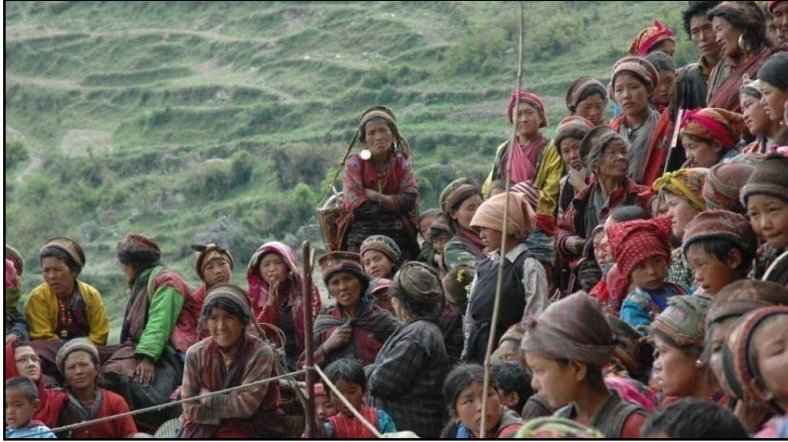
चित्र नं. ४: रसुवामा गरिएको सामुदाय भेला

यस आयोजनाको मुख्य उपलब्धि भनेको कुनै एक समुदायको एक ठूलो हिस्सा, मुख्यतः समुदायका गरीबहरु, सँग त्यस क्षेत्रमा अवस्थित जलसम्पदाको प्रयोग गर्ने नाफामुखी जलविद्युत आयोजना बनाउने कम्पनीको